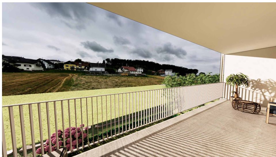
Haus 3_0G-Top 06